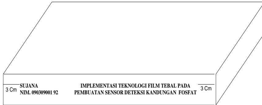
Gambar 2.1 Sampul Tugas Akhir